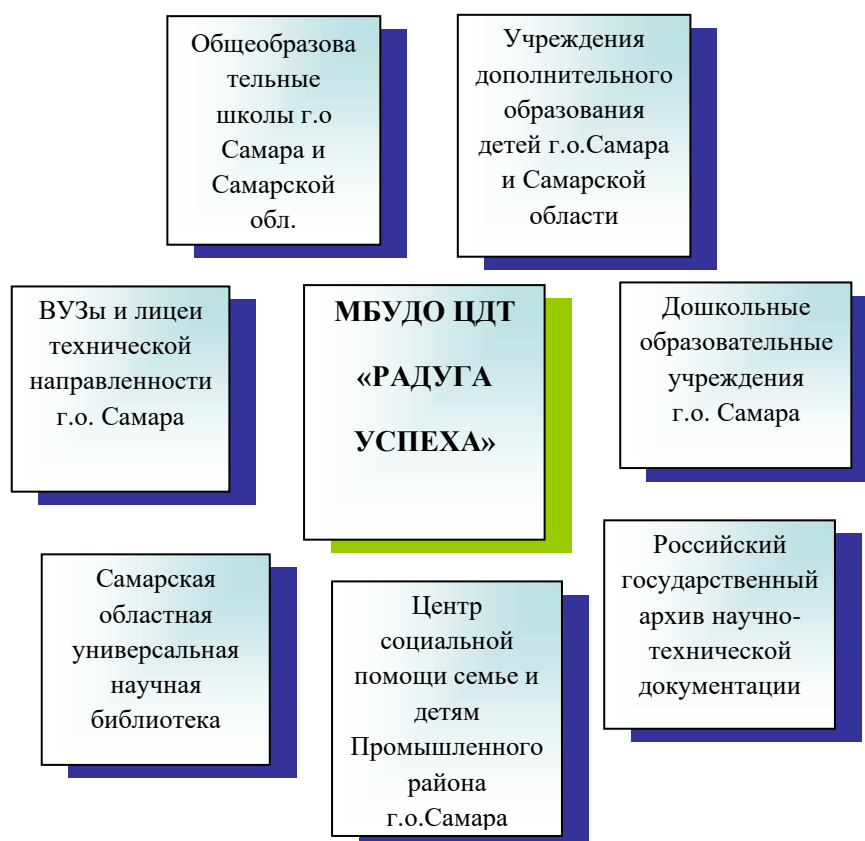
Модель государственного партнерства

Целью данного сотрудничества является популяризация направлений деятельности, вовлечение в образовательный процесс потенциальных участников, распространение опыта работы ЦДТ «Радуга успеха».