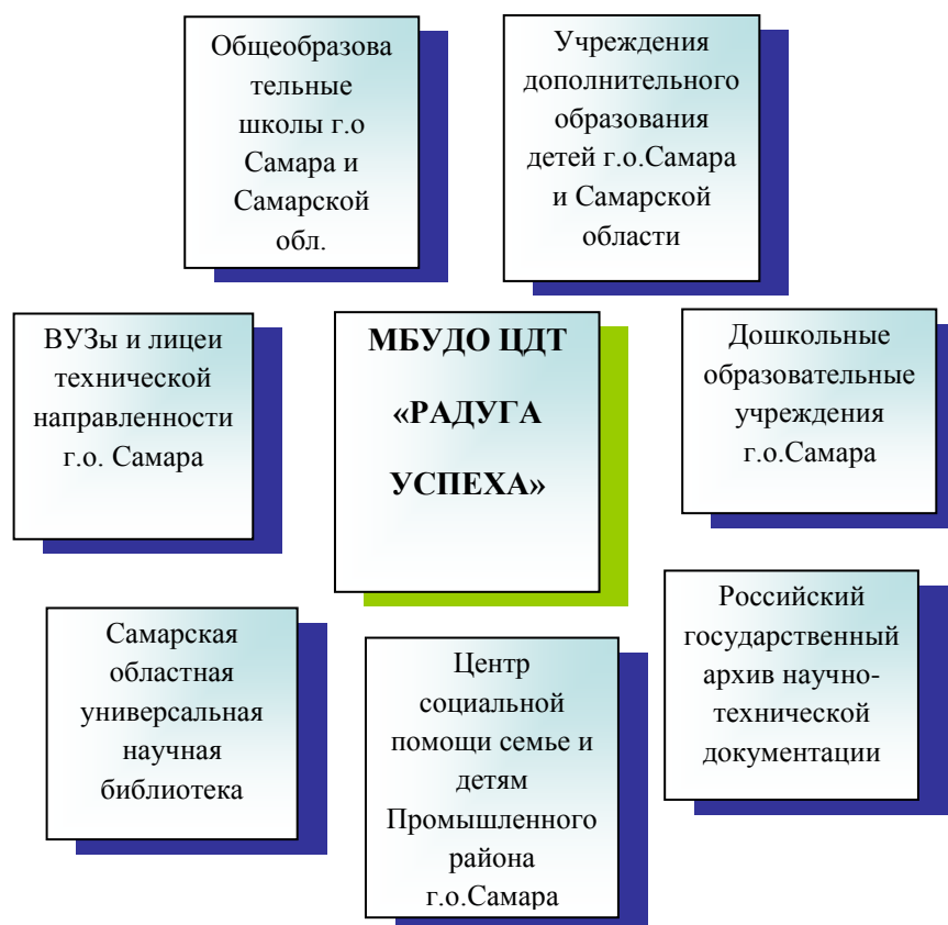
Модель государственного партнерства

Целью данного сотрудничества является популяризация направлений деятельности, вовлечение в образовательный процесс потенциальных участников, распространение опыта работы ЦДТ «Радуга успеха».